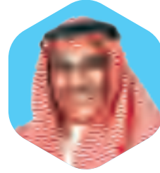
الشيخ / سلمان داود الصباح عضواً